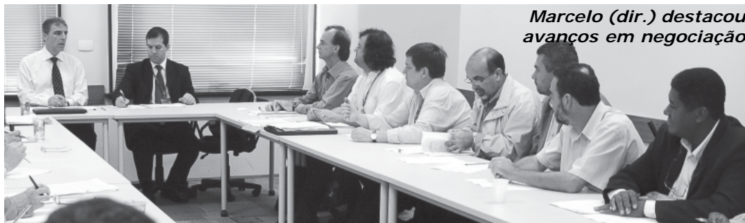
Marcelo (dir.) destacou avanços em negociação

O Santander aceitou a reivindicação dos bancários e ofereceu 700 bolsas de auxílio-educação, no valor de 50% da mensalidade com teto de R$ 250 para primeira graduação em cursos. Apesar do avanço, já que o banco nunca havia aceitado essa reivindicação dos funcionários, a Comissão de Organização dos Empregados