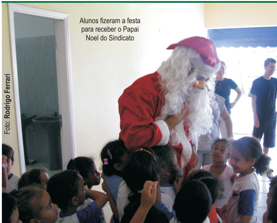
Alunos fizeram a festa para receber o Papai Noel do Sindicato