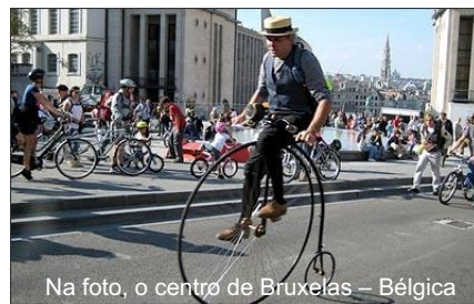
Na foto, o centro de Bruxelas — Bélgica

Será distribuída água durante o trajeto, não sendo necessário levar garrafas descartáveis.