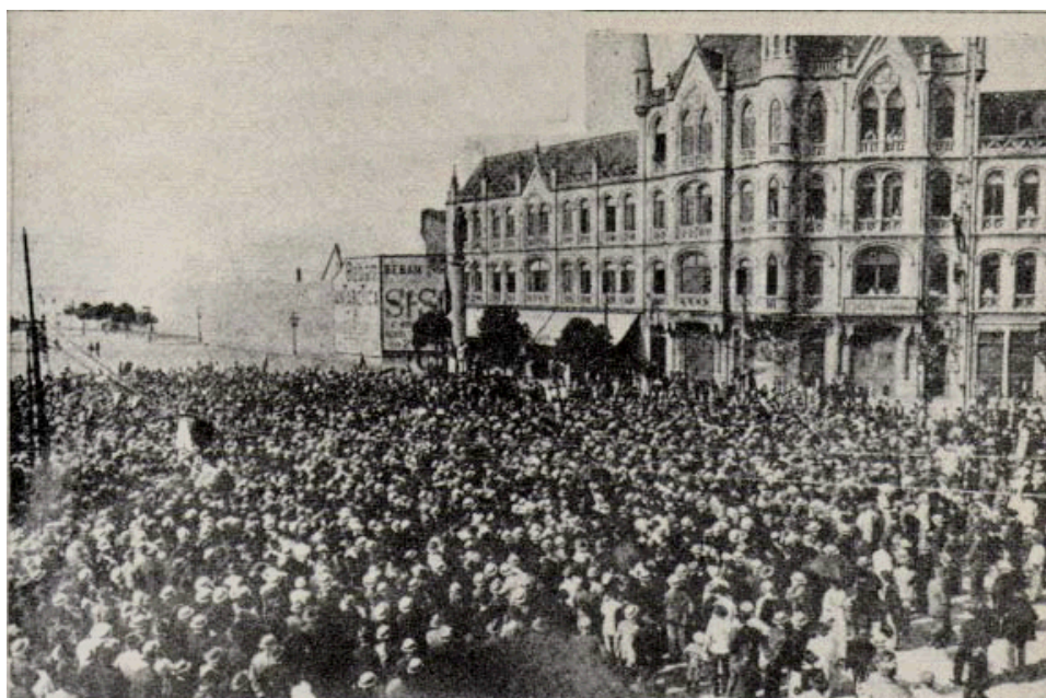
Manifestação de trabalhadores - 1.º de maio de 1919 - Rio de Janeiro (in Revista da Semana, 10/05/1919)

Quem construiu a Tebas das sete portas? Nos livros constam os nomes dos reis, Os reis arrastaram os blocos de pedra? E a Babilônia, tantas vezes destruída, Quem a ergueu outras tantas? Em que casas da Lima radiante de ouro Moravam os construtores? Para onde foram os pedreiros No dia em que ficou pronta a Muralha da China? A grande Roma está cheia de arcos de triunfo. Quem os levantou? Sobre quem triunfaram os césares? A decantada Bizâncio só tinha palácios Para seus habitantes? Mesmo na legendária Atlântida, Na noite em que o mar a engoliu Os que se afogavam gritavam pelos seus escravos. O jovem Alexandre conquistou a Índia Ele sozinho? César bateu os gauleses. Não tinha pelo menos um cozinheiro consigo? Felipe de Espanha chorou quando a sua Armada naufragou. Ninguém mais chorou? Frederico II venceu a Guerra dos Sete Anos Quem venceu, além dele?